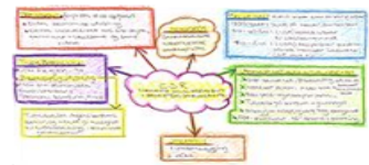
الخرائط الذهنية (Tankekart)