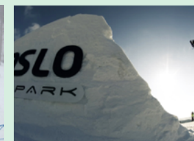
Opplæringsdagen vil være i Oslo Vinterpark.