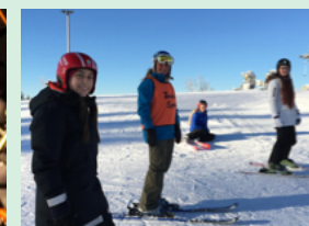
Den som trener - blir god. Bruk ordningen masse!