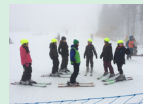
Man kan velge mellom snowboard og slalåm.

Alle 7.klassene får en gratis opplæringsdag i Oslo Vinterpark Tryvann i uke 3. De må da velge enten slalåm eller snowboard. Transport vil foregå med buss fra skolene. Opplegget er frivillig og påmeldingsskjema må være godkjent og signert av foresatte. Skolen har et alternativt opplegg for de som ikke ønsker å delta. 8-10.klassingene som ikke deltok i fjor, vil få tilbud om kveldsopplæring med FRIGO - men må selv aktivt melde seg på dette.