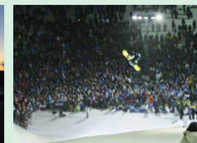
Heia X Games Norway. Heia Ø på SNØ!